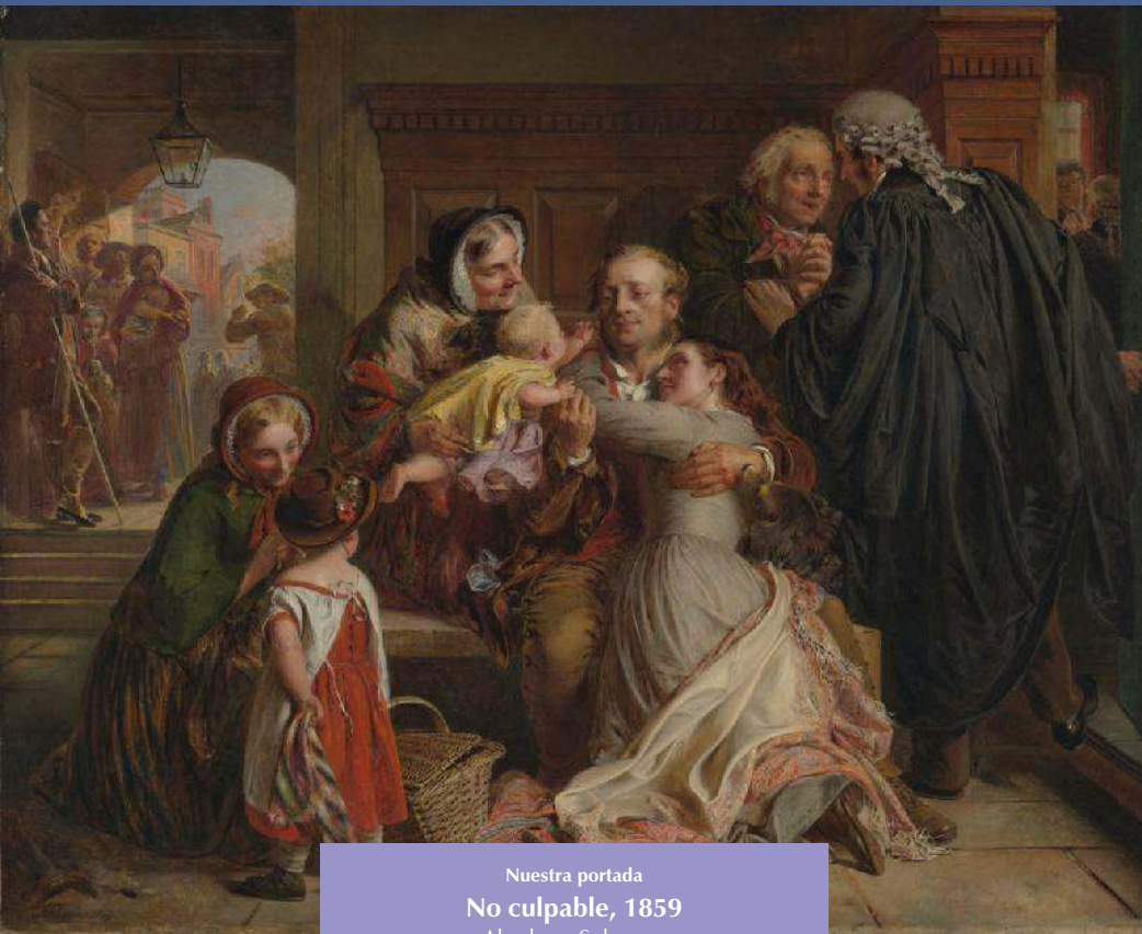
Nuestra portada No culpable, 1859 Abraham Solomon

Comisión de Derechos Humanos e igualdad de Irlanda Por los derechos humanos de las mujeres José Gilberto Garza Grimaldo XVI